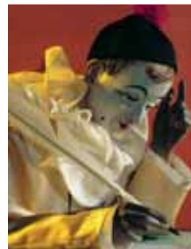
Le Musée National : Automates et Poupées d'Autrefois 17, avenue Princesse-Grace - Monte-Carlo Tél. + 377 93 30 91 26 Fax + 377 92 16 73 21